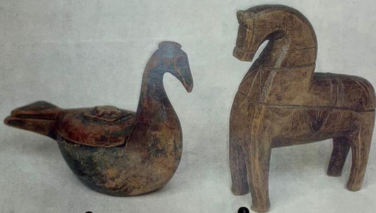
«Солонца» конец XIX века