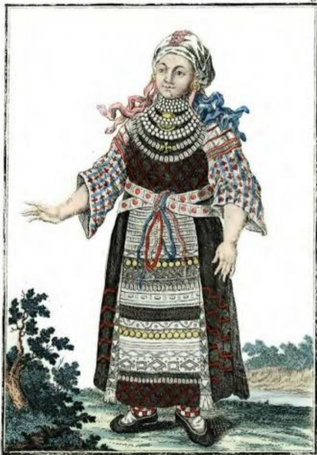
Чухонка въ уборномъ платьѣ. Eine Finnin im Feiertags-Kleide. Femme finnoise dans son habit des fêtes.

КОМПЛЕКС С ААННУА. ХЭВАСКИЕ ИЖОРЫ. ИЗВЕСТНА АРХАИЧНАЯ ФОРМА ОДЕЖДЫ У ЦЕНТРАЛЬНЫХ ИЖОРЦЕВ В РАЙОНЕ КОВАШЕЙ.